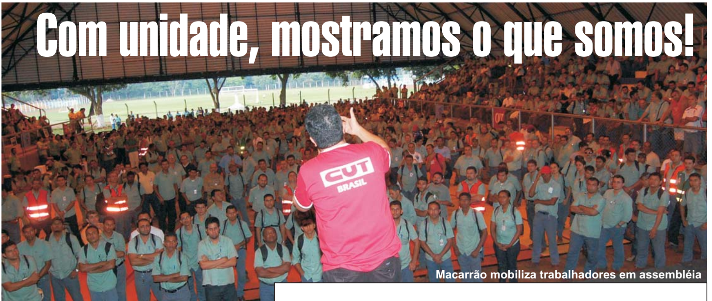
Macarrão mobiliza trabalhadores em assembléia

As mobilizações históricas sempre garantiram nossas conquistas!